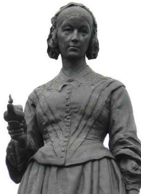
Флоренс Найтингейл (1820 – 1910)